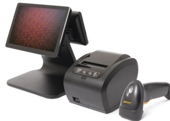
● POS-система Amber POS