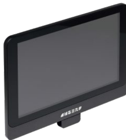
● Прайс-чекер Amber Check