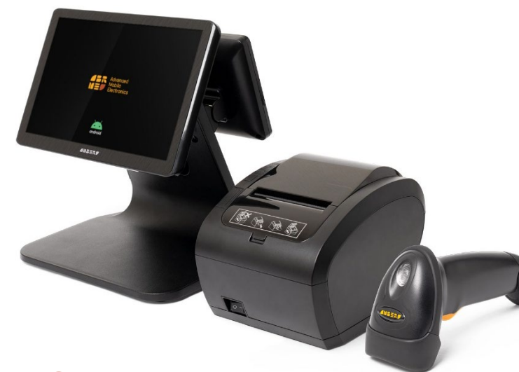
● POS-система Amber POS