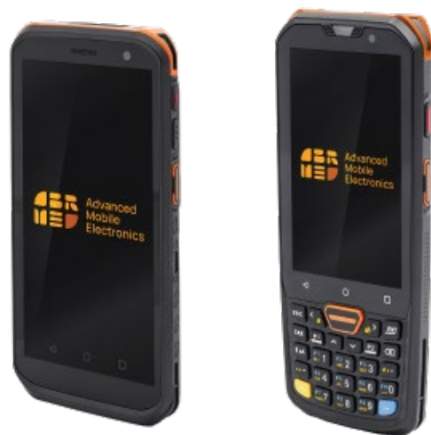
● Терминалы сбора данных Amber InfoData