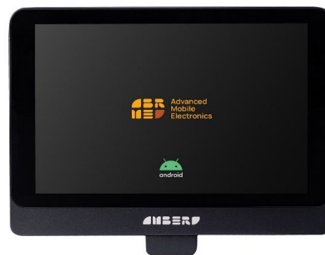
● Прайс-чекер Amber Check